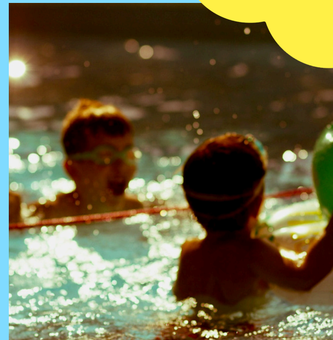
Piscina Comunale di Pasiano di Pordenone